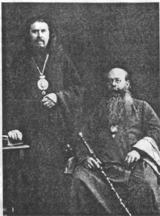
Архиепископ Иннокентий Ястребов (справа) со своим учеником архиепископом Иннокентием Летяевым

имени Ея демоны тают...” “Изумевает ум премирный пети Тя, Богородицу” – “неусыпную Попечительницу сущих в изгнании”. Становилось понятным, почему в те времена, когда монашество шло в подполье, такие крупные иерархи, как, например, архиепископ Варфоломей 5 Высоко-Петровского монастыря в Москве, и мой “отец от Евангелия” архиепископ Иннокентий (старейший, постоянный член Святейшего Синода, магистр богословия), и другие, имели патриаршее благословение на постриг молодых послушниц: если Вы, дорогая Матушка, вы, счастливицы, дожившие до истинного счастья быть явными монашествующими, вы получаете