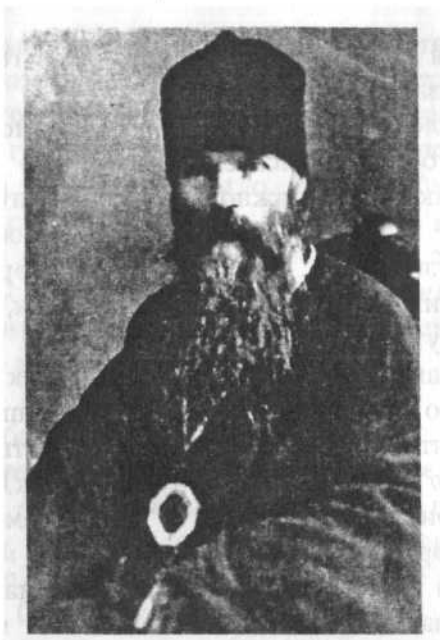
Епископ Герман (Ряшенцев), священномученик (1874—1937)