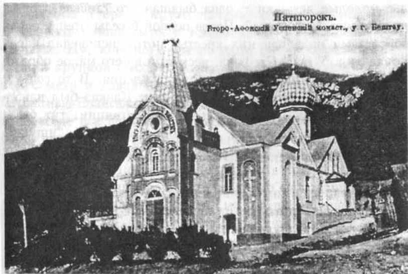
Второ-Афонский Успенский монастырь

нас так: сначала вели к утрени, а потом завтракать, и во время завтрака читали нам жития святых. И запали мне в сердце особенно два жития – житие святого Алексия Божьего человека и преподобного Антония Великого. И загорелось сердце любовью к монашеству”.