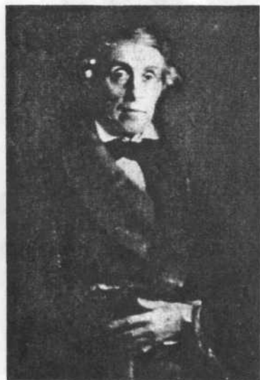
Граф Федор Петрович Толстой (1783–1873)

туда и увидела такую картину – из наружной двери торчит рука с зажатыми бумажными деньгами, папа хлопает дверью по этой руке и кричит: “Я не взяточник, я не взяточник!” Мамочка поспешила остановить папу, говоря: “Отпусти же его, ведь ты сам его задерживаешь, а он ничего не понял: ведь ты один не берешь взятку, а он, наверное, думает, что мало дал”.